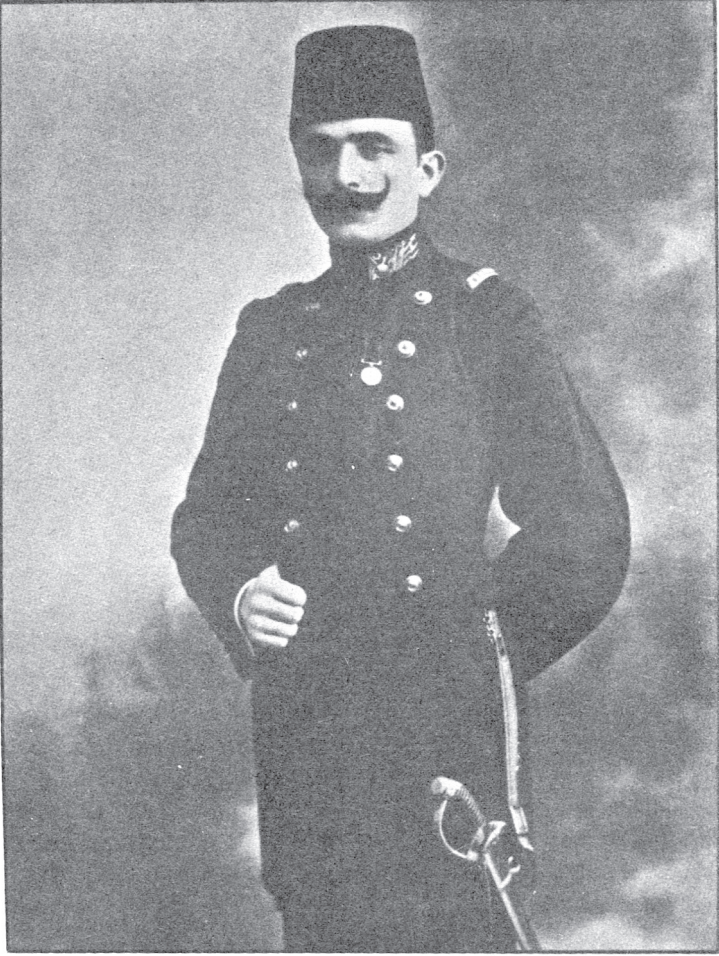
(Binbaşı) Enver Bey Hürriyet Kahramanı