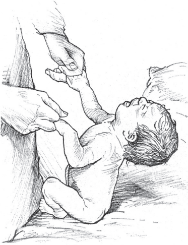
3. Oturur konuma çekme.