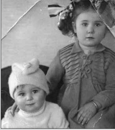
21 Haziran 1950'de Muğla'da dünyaya geldim...