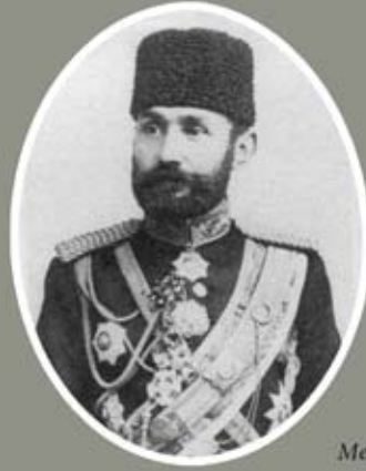
Mehmet Şakir Paşa

Bu kitapta anlatılanlar, Osmanlı İmparatorluğu'nun son dönemine ve Cumhuriyet'in kuruluş yıllarına tanık olmuş, ülkemize Cevat Paşa, Şakir Paşa gibi devlet adamları ile, Fahrünnissa Zeyd, Aliye Berger, Füreya Koral, Cevat Şakir gibi sanatçılar armağan etmiş bir ailenin, Şakir Paşa ailesinin hikâyesidir.