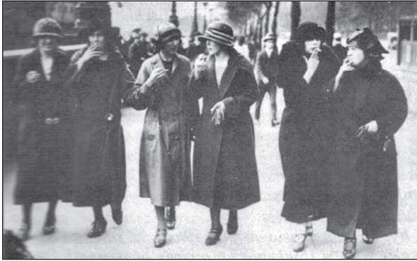
Bernays'in Paskalya şovu

Olay sadece New York gazetelerinde yer almadı, Amerika Birleşik Devletleri'nin her köşesinde ve dünyanın dört bir yanında yankılandı. Ertesi gün, American Tobacco Company'nin ürünleri, The New York Times tarafından övüldü. Birinci sayfa haberi şöyleydi: "Bir grup genç kız sigarayı Özgürlük Hareketi'nin simgesi yaptı."