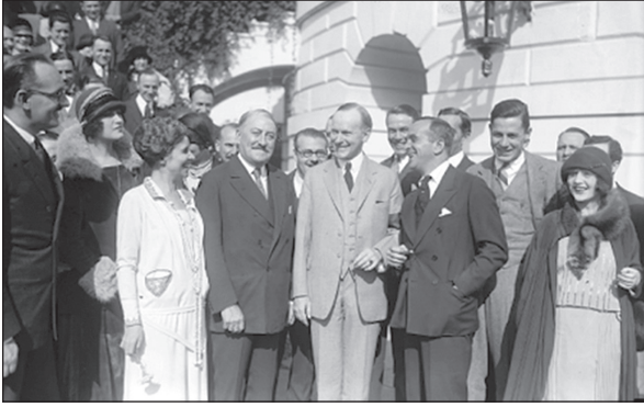
Başkan Coolidge ve Broadway sanatçıları

“Yarış şimdi başladı ve Coolidge o kişi. Cumhurbaşkanlığı koltuğunu dolduracak olan o. Sessiz sedasız millet için çalıştı. Minnetimizi gösterelim onu orada tutalım!...”